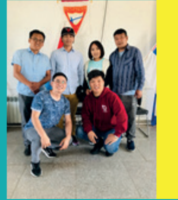
Missionários do distrito oriental e pastores reunidos na igreja de Nalaikh, em Ulaanbaatar.