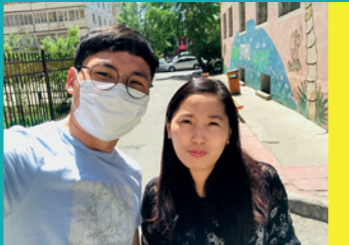
Êgui junto com a senhora que está sendo preparada como líder do ministério da mulher